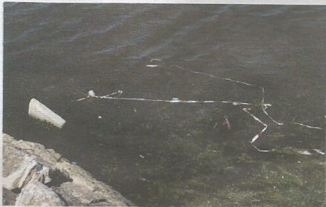
Postavljeni stupići završili su u moru

Dar iz Pazina kao je prekineć na oštećen