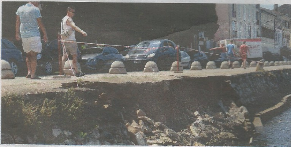
Kraj urušenog dijela obale svakodnevno prolaze turisti i domaći

- Prostor je u ingerenciji Grada Poreča, mi smo odmah napravili uvid na terenu, troškovnik i ogradili teren. Trebalo je prikupiti svu dokumentaciju, napraviti tehničko rješenje i izabrati projektante što je bila zakonska obveza zbog čega je sve toliko čekalo. Konačno je odabran ponuditelj za izvođenje radova i u ponedjeljak krećemo sa sanacijom. Troškovi zahvata koštati će 130 tisuća kuna plus PDV, rekao nam je Laković.