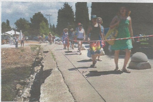
Opasni dio frekventne šetnice