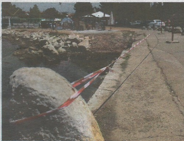
Područje je zaštićeno tek plastičnom trakom

Nakon što se obalni zid počeo urušavati prije dva mjeseca, komunalci su ga "zaštitili" stupićima i trakom, no prije dva dana netko ih je bacio u more, što je vjerojatno kumovalo nesreći